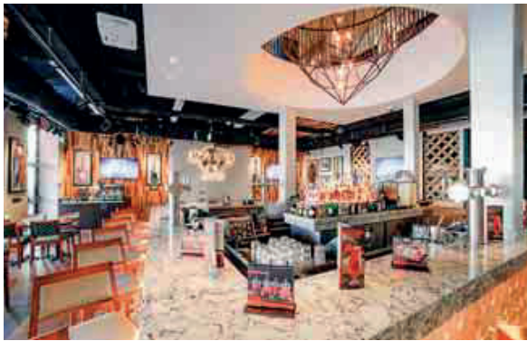
Hell und design-affin präsentiert sich das neue Hard Rock Cafe am Groenplaats in Antwerpen.

Erst Mitte März wurde das neue Hard Rock Cafe in Antwerpen eröffnet. Eigentlich als eine Art zweiter Versuch. Denn zwischen 1995 bis 1997 befand sich, genau an gleicher Stelle, schon einmal ein Hard Rock Cafe. Direkt am Groenplaats und somit zwischen den wunderschönen alten Zunfthäusern aus dem 16. und 17. Jahrhundert, direkt in der Innenstadt Antwerpens. Jetzt, fast genau 20 Jahre später, empfängt das Hard Rock Cafe Antwerp wieder Gäste und selbstverständlich auch MICEler. Bis zu 250 Personen finden in dem vollständig renovierten und neu designten Cafe Platz. In typischer Hard-Rock-Manier können einzelne Bereiche, ganze Etagen oder das gesamte Cafe gebucht und bespielt werden.