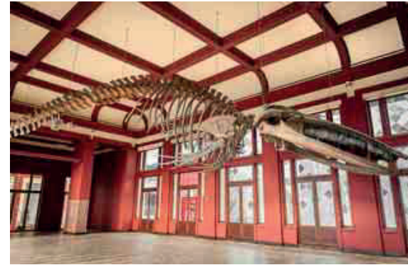
Passend zum Namensgeber hängt ein beeindruckendes Bartenwal-Skelett an der Decke des Darwin-Saals.

Da Okapis ihr Leben meist auf dem Erdboden verbringen, ist der zweimal teilbare Okapi-Raum mit seinen insgesamt 545 qm im Erdgeschoss untergebracht. Eine Etage darüber befindet sich der Raum Gorilla. Vier Mal lässt sich dieser lichtdurchflutete Saal teilen und bietet bei einer Gesamtnutzung Platz für bis zu 500 Personen. Die oberste Etage des Neubaus verfügt über insgesamt vier Räume mit unterschiedlichen Kapazitäten. Alle übrigen nach verschiedenen Vogelarten benannt.