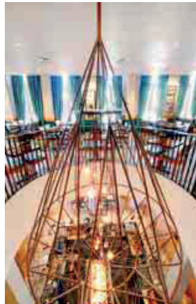
li.: Local spirit: In Form eines Diamanten wurde der riesige Kronleuchter, der beide Etagen des Cafes miteinander verbindet, gestaltet. re.: Getragen von Lady Gaga, design von Toon Geboers, während seines Studiums in Antwerpen.

leuchter positioniert, der durch seine Diamanten-Form die Verbundenheit des Hauses zu Antwerpen und seiner Geschichte noch einmal unterstreicht. Wer diesen Bereich für Veranstaltungen mieten möchte, bringt je nach Layout maximal 58 bis 80 Personen unter. Bei weniger Platzbedarf können auch nur einzelne Teile oder Tische gemietet werden. Ähnlich flexibel ist die Nutzung der LED-Bildschirme. Ob die Steuerung synchron, einzeln oder versetzt erfolgen soll, entscheidet zum einen der Planer selbst und richtet sich zum