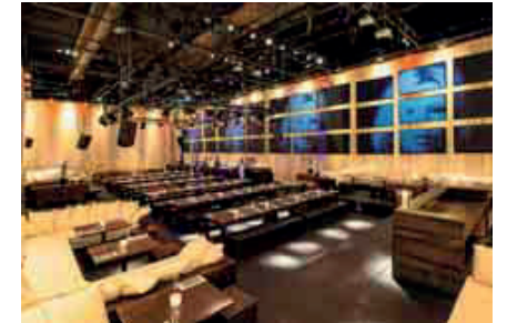
Top-Location direkt an der Spree: Das „Spindler & Klatt“ überzeugt durch die großzügigen und sehr flexiblen Möglichkeiten.

würde. Für kleinere Veranstaltungen gibt es außerdem noch die Empore, die den Blick auf die untere Ebene freigibt. Bis zu 100 Personen können hier dinieren oder konferieren. Je nach Bedarf können Tische und Arbeitsflächen rund um die eigene Bar des Bereiches gruppiert und arrangiert werden. Zusätzlich zu den Innenflächen verfügt das „Spindler & Klatt“ außerdem neben der Terrasse mit direktem Blick auf die Spree gibt es noch die Wood Lounge – eine