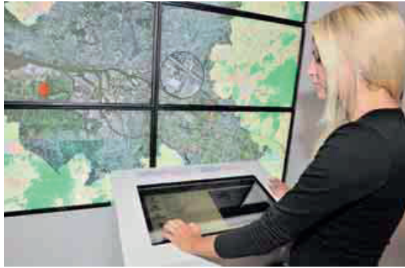
Auch sie sind Teil des IT-Standorts Hamburg: Blick ins Deutsche Klimarechenzentrum sowie in den Infopavillon Green Capital

merce abgedeckt – vom reinen Onlinehandel über Social oder Mobile Commerce bis zu diversen IT-Dienstleistungen und Online-Marketing sind in der Hansestadt entsprechende Unternehmen vertreten. Um die Position als führenden Standort künftig noch zu stärken, hat Hamburg@work mit bekannten Partnern aus der Wirtschaft das Aktionspro-