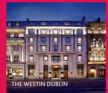
THE WESTIN DUBLIN