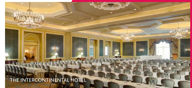
THE INTERCONTINENTAL HOTEL