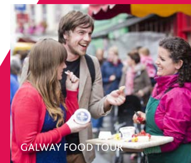
GALWAY FOOD TOUR