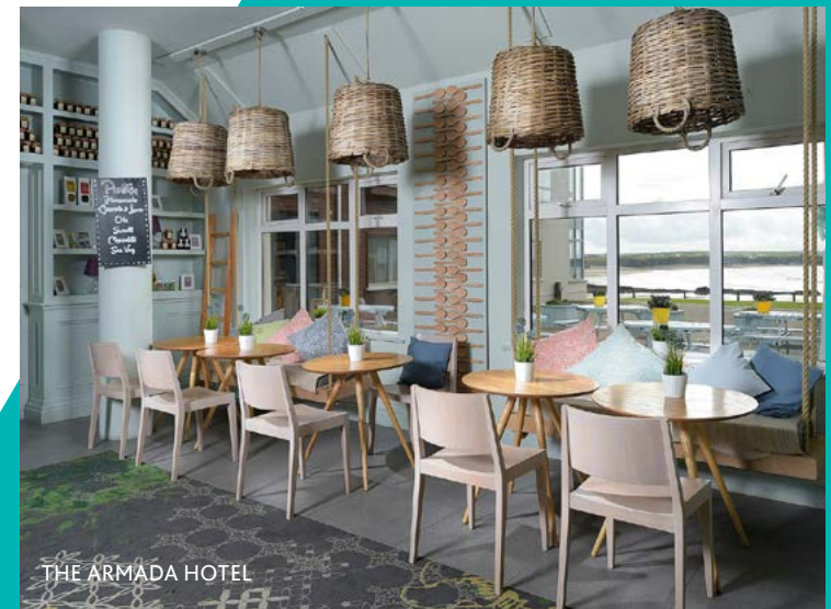
THE ARMADA HOTEL