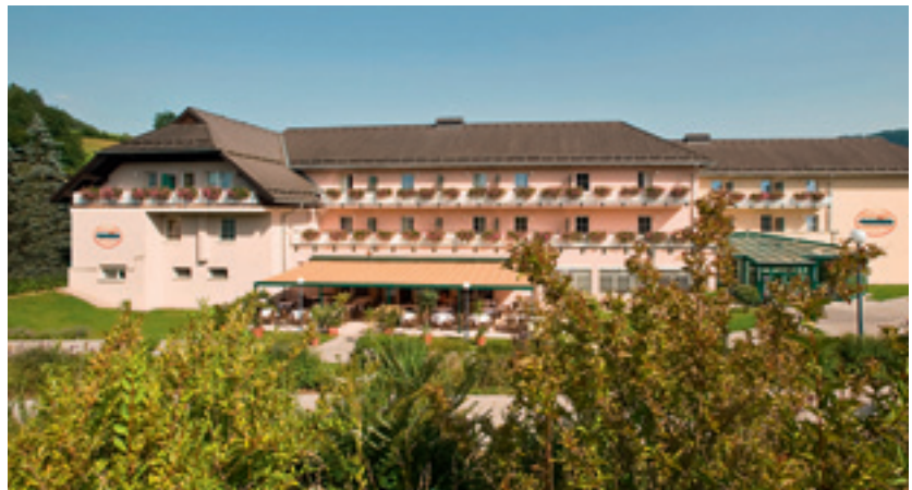
Enorme Flexibilität und große Kapazitäten sind ein definitives Plus im Sonnenhotel Hafnersee .

Nur etwa 20 Minuten vom Zentrum Klagenfurts entfernt wartet eine kleine Ruhe-Oase. Direkt am Hafnersee gelegen bietet das Sonnenhotel Hafnersee Veranstaltungsbesuchern wie Geschäftsreisenden gleichermaßen sowohl gute Erreichbarkeit, als auch die nötige Ruhe für effizientes Arbeiten. Gleich sieben Veranstaltungsräume unterschiedlicher Größe stehen hier bereit. Bedingt durch die Nähe zum See und die Bedeutung der Seen für die Kulturlandschaft in Kärnten wurden auch alle Veranstaltungsräume nach einigen Seen des Bundeslandes benannt. Im größten Raum des Ensembles – der passenderweise Wörthersee heißt – finden bis zu 240 Personen Platz. Vollkommen flexible Bestuhlungsvarianten ermöglichen größtmögliche Gestaltungsfreiheit innerhalb der sieben Veranstaltungsräume. Ausgehend vom weitläufigen Foyer im Erdgeschoss sind alle Räume barrierefrei erreichbar und verfügen teilweise auch über einen direk-