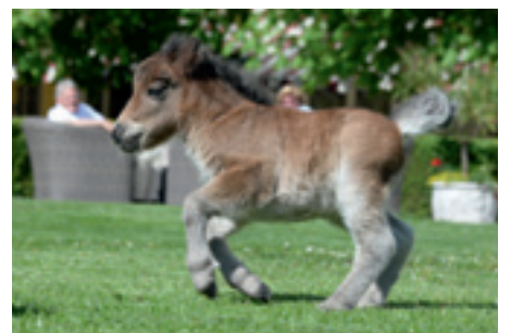
Das von der Familie Hiesel geführte Hotel beherbergt neben 50 Einstellerpferden auch eine kleine Herde von Miniponys