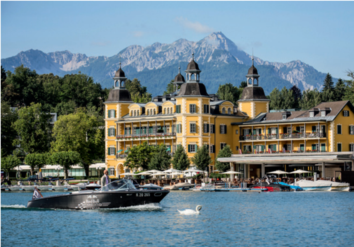
Mit dem Schlosshotel Velden hat die Falkensteiner Gruppe ein wahres Juwel im Portfolio. Vielen ist das Schloss vor allem durch Roy Black und die Fernsehserie „Ein Schloss am Wörthersee“ bekannt.