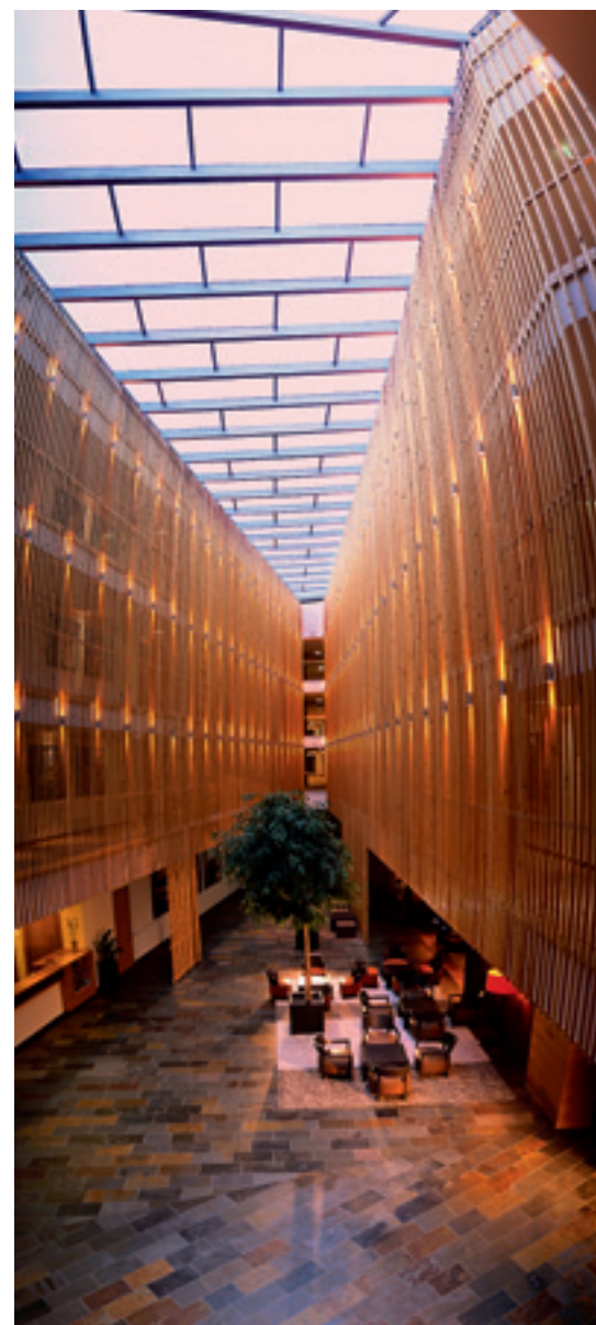
Architektur meets Lobby. Holzstreben und Glasdach verleihen der Lobby im Carinzia eine ganz besondere Atmosphäre

Das „Schloss am Wörthersee“ ist für viele die direkte Verbindung zur gleichnamigen TV-Serie aus den 90ern und ihrem Hauptdarsteller Roy Black, dem nicht zuletzt am Seeufer, direkt gegenüber dem Hotel, ein Denkmal gewidmet wurde. Das gelbe