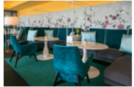
Sogar das SPA-Restaurant ist für Gruppen nutzbar.

80 Teilnehmer. Für einen etwas unkonventionelleren Rahmen hat das Schlosshotel Velden aber auch noch zwei weitere Möglichkeiten zu bieten: Das Restaurant des 3.600 Quadratmeter großen Spa Bereichs, sowie die Kaiser Suite. Die 300 Quadratmeter große, exklusivste Suite des Schlosshotels ist für außergewöhnliche Events und Get-togethers ebenfalls buchbar. Die Suite-eigene Terrasse mit Blick auf den Wörthersee ist selbstverständlich im Package enthalten.