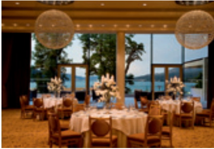
Das mondäne Ambiente im Ballsaal des Schlosses lädt vor allem zu exklusiven Abendveranstaltungen ein

der Planungsphase fügt sich der Neubau homogen in das Bild des historischen Gemäuers ein. Durch diesen Umbau erweiterte das heutige Fünf-Sterne-Haus seine Kapazität auf insgesamt 104 Zimmer und Suiten. Seit 2012 steht das geschichtsträchtige Anwesen nun unter Führung der Falkensteiner Hotelgruppe. Die gelungene Kombination aus Alt und Neu zeigt sich aber vor allem im Ver-