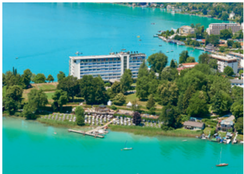
Parkhotel Pörtschach: Seeblick aus allen Zimmern.

Ebenfalls am Wörthersee gelegen ist das Parkhotel Pörtschach. Das Traditionshaus wurde in den 60ern errichtet und zählt bis heute zu den Top-Adressen rund um den See. Während andere Hotels angestrengt versuchen, auf den Retro-Zug aufzuspringen, hat sich das Parkhotel den Original-Charme der sogenannten Swinging Sixties bewahrt. Viele authentische Stücke aus der Zeit kurz nach Eröffnung sind bis heute noch in den Mauern des ersten österreichischen Designhotels erhalten. Trotz der Besinnung auf die alten Zeiten wurden die über die Jahre notwendigen Renovierungen nicht vergessen. Aber auch hier teilweise wieder der bewusste Fokus auf die 60er. In einigen der gerade erst renovierten Zimmer wurde