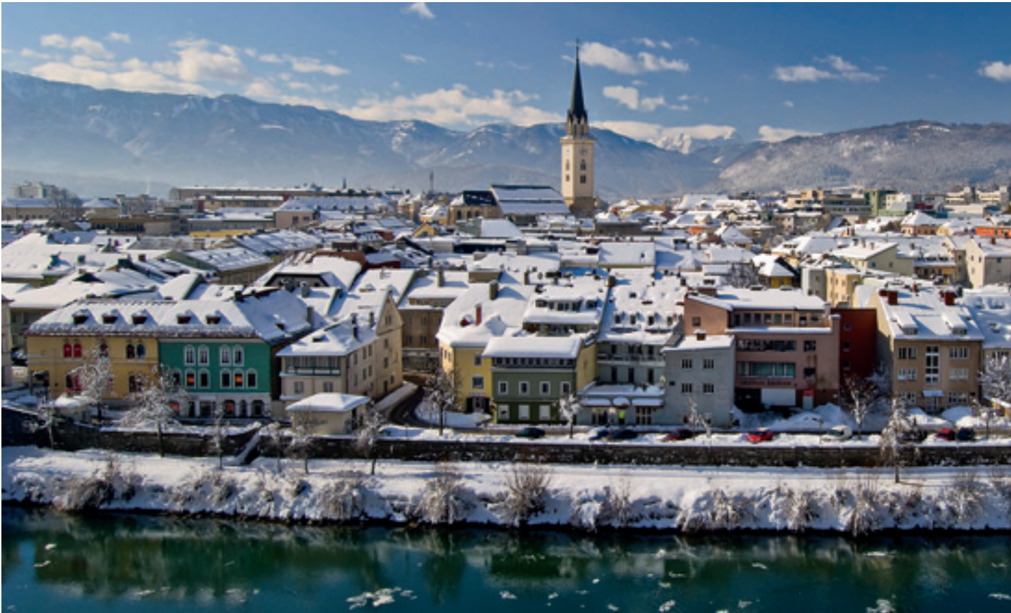
Fast malerisch präsentiert sich der Blick auf Villach vom Congress Centrum aus.