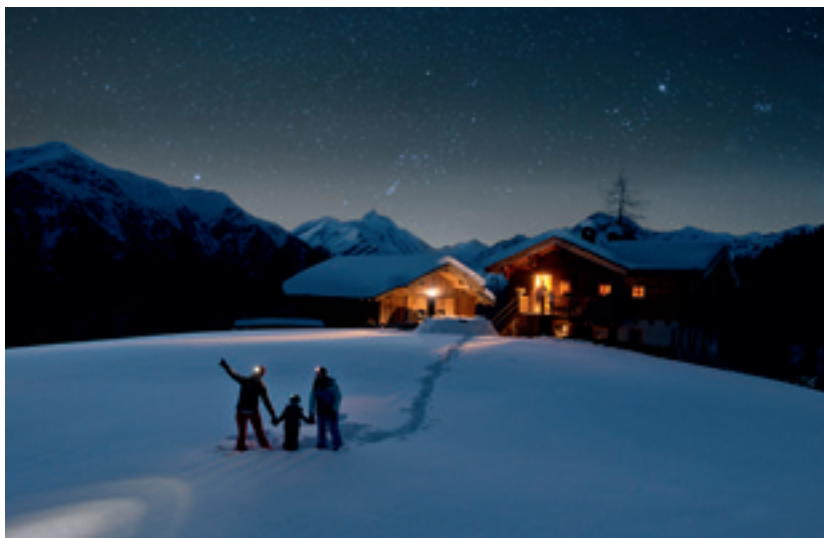
Nächtliches Highlight: Für Gruppen ist die Sternenwanderung ein unvergesslich-stellares Erlebnis

chen Rezepten zubereitete Speisen. Für die passende Atmosphäre sorgen sowohl Esmeralda, die Bauchtänzerin, als auch Pfeifer, Trommler und Lautenschläger. Zurück in der Zukunft erwartet den Planer noch eine weitere Möglichkeit. Wer sich zwei Tage Zeit nimmt, kann sich zum Ranger ausbilden lassen. Im Biosphärenpark in den Nockbergen heißt es im wahrsten Sinne des Worte „Back-to-Nature“. Mit bestens ausgebildeten Rangern geht es – nach einem 3D Film über den Biosphärenpark – los in die Wildnis. Ein Überlebenstraining gehört genauso zum Programm wie die authentische Übernachtung auf einer Almhütte oder im Heustadl. Auf dem Weg zum Schlafplatz erfährt der Nachwuchs-Ranger dann alles Wichtige über Lagerbau, Fährtenuche, Naturkunde und Geologie. Wer mehr Action sucht, sollte sich am Möllfluss umsehen: einer der großen Gletscherflüsse der Ostalpen ist ein wahres Paradies für Rafting . Schnelle Wildwasserpassagen wechseln sich mit ruhigen Abschnitten ab. Hier bleiben die Füße zwar nicht unbedingt trocken, aber Spaß und Spannung sicherlich auch nicht auf der Strecke. Mit einem geprüften Rafting-Guide geht es zwischen Juni und September für circa drei Stunden in die spektakuläre Natur rund um den Möllfluss.