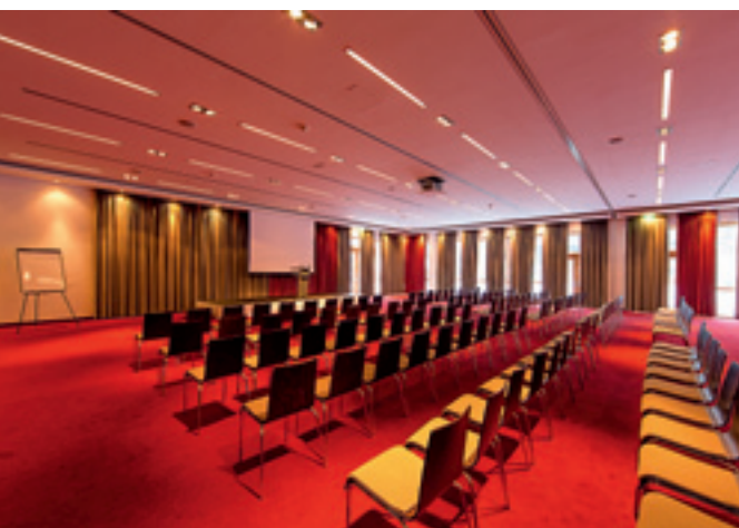
Bis zu 360 Personen finden im größten Raum des Carinzia Conference Center Platz

Schloss am Ufer des Wörthersees – dem größten Kärntner See – steht noch heute als nostalgisches Symbol für TV-Unterhaltung aus dieser Zeit. Viele Jahre sind seitdem vergangen. Und vieles hat sich verändert. Anders als noch zu Zeiten der Serie liegt der Eingangsbereich heute auf der Seeseite und nicht mehr im Innenhof des alten Schlosses. Auch der markante Springbrunnen musste neuen architektonischen Anforderungen weichen. Unter amerikanischer Führung erfuhr das Schlosshotel in den Jahren 2005 bis 2007 wohl seine bedeutendste Umbauphase. Mit regionalen Baufirmen wurde ein vollständiger Neubau in U-Form um das alte Schloss herum realisiert. Trotz der Bedenken vieler Einheimischer in