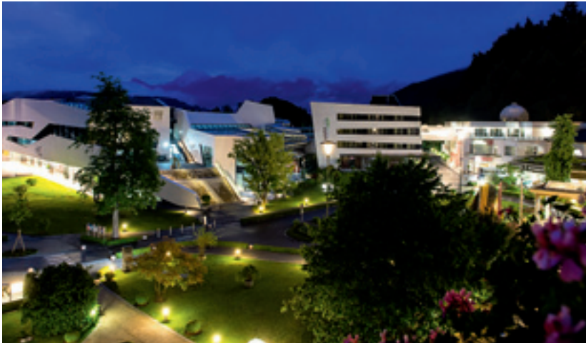
Auf 130 Hektar bietet das Thermenresort Warmbad-Villach zahlreiche Möglichkeiten für MICE-Profis.

Das 130 Hektar große Thermenresort Warmbad-Villach umfasst Warmbaderhof, Karawankenhof und Kärnten-Therme. Hier präsentiert sich MICE-Profis mitten im Wald ein einzigartiges Naturschauspiel. Das Maibachl ist eine natürliche Thermalquelle, die unter den entsprechenden Bedingungen – Schneeschmelze am Dobratsch und genügend Regen aus der Adria-Region – mit 28 Grad warmen Thermalwasser aus der Erde tritt. Dann füllen sich nicht mehr nur die unterirdischen Wasserspeicher, sondern auch zwei Naturbecken oberhalb. Wenn also das Maibachl rinnt, bietet sich die außergewöhnliche Möglichkeit, in diesem Naturbecken nach Seminar oder Konferenz zu entspannen. Für eben diese Konferenzen oder andere Business-Veranstaltungen finden sich auf dem Areal des Thermenresorts hervorragende Bedingungen. Angefangen beim Warmbaderhof, der mit 99 Zimmern und Suiten sowie dem Parksalon (max. 150 Personen) und dem grünen