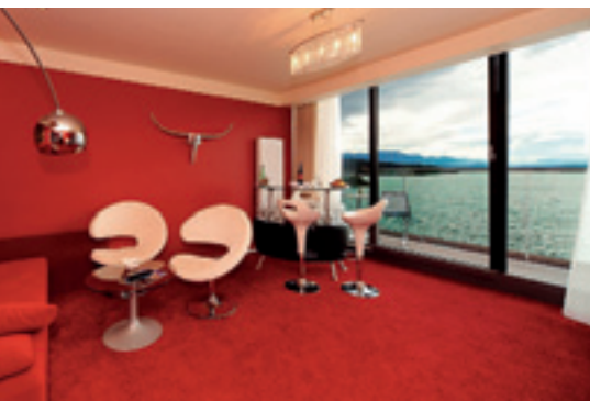
Klare Linien, knallige Farben: Zeitreise inklusive

verlässlicher Partner. Veranstaltungen von zwei bis 1.000 Personen sind auf dem Hotelgelände ohne weiteres möglich. Vier Seminarräume, 40.000 Quadratmeter Parkanlage, sowie ein Strandbad inklusive Strand stehen auf der Pörtschacher Halbinsel zur Verfügung. Wem das nicht ausreichen sollte, kann sich auch zum Congress Center Wörthersee orientieren. Hier sind Veranstaltungen für bis zu 500 Personen möglich.