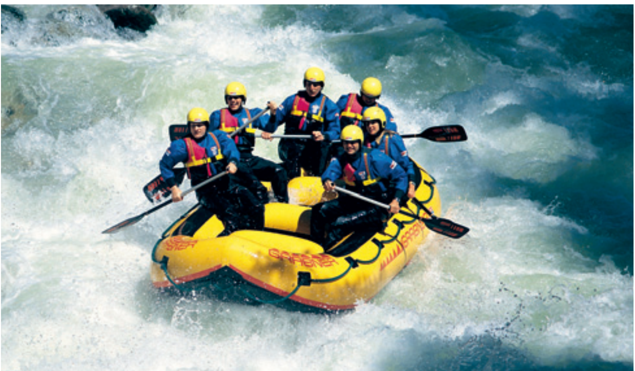
Immer wieder ein feucht-fröhliches Abenteuer: Rafting .

ein Jahreskalender-Shooting ins Auge fassen. In Teams werden die einzelnen Sets für die entsprechenden Monate geplant und umgesetzt. Und als Models agieren die Mitarbeiter selbst. Entsprechende Jahreszeitentypische Requisiten wie Sonnenbrille und Schwimmflügel finden sich immer im Studio-Fundus und dürfen gerne genutzt werden. Im Anschluss an die Fotosession wird der Kalender inklusive eines Making-ofs präsentiert. Für das Büro, gibt es dann natürlich auch ein Exemplar zum Aufhängen.