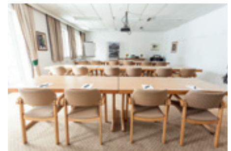
Veranstaltungsplaner schätzen die effiziente Arbeitsatmosphäre im Dienstl Gut

Wer sich traut, kann im Anschluss auch noch an einem sogenannten Schnupperreiten teilnehmen. In jedem Fall eine ganz besondere Sache – auch für den erfahrenen Planer.