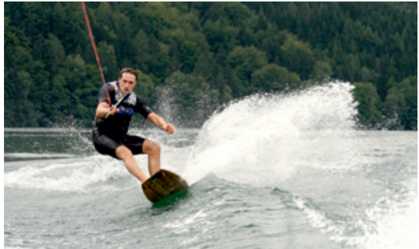
Erst Wedeln auf dem Gletscher, danach Wasserski auf dem Mittelstätter See.

Morgens Ski fahren, nachmittags Wasserski fahren. Eine etwas ungewöhnliche Kombination, die in Kärnten aber durchaus realisierbar ist. Für ein Ganztages-Programm lassen sich diese beiden Extreme als Double-Skiing hervorragend miteinander verbinden. Morgens früh geht es per Bustransfer rauf auf den