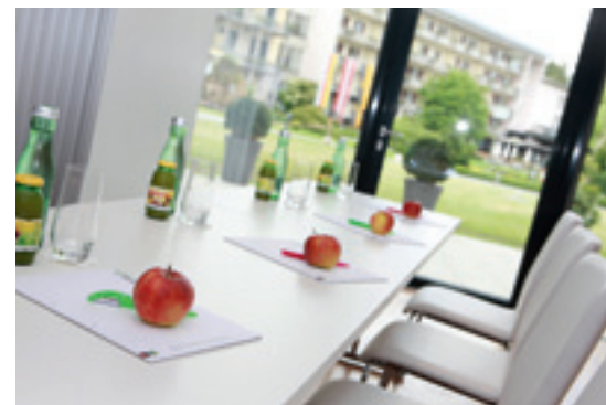
Mit Blick ins Grüne lässt es sich im Karawankenhof hervorragend tagen.

Auch der im Erdgeschoss gelegene Meetingraum des Hotels überzeugt mit seiner Glasfront, die einen direkten und weitläufigen Blick ins Grüne erlaubt. Bei Bedarf kann der ganze Raum aber auch per Jalousie verdunkelt werden. Durch flexible Trennwände lässt sich der 130 Quadratmeter große Raum ohne Schwierigkeiten in zwei kleinere Räume mit 50 beziehungsweise 80 Quadratmeter unterteilen – je nach Anforderung. Auch für längere Business-Aufenthalte in Villach hält der Karawankenhof die