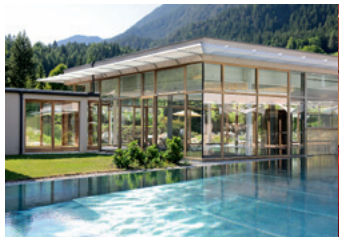
3.600 Quadratmeter verglaster Spa-Bereich im Bleibergerhof

auch Veranstaltungsplaner rund um gut beraten fühlen. Auf 920 Metern Seehöhe liegt das Vier-Sterne-Haus und überzeugt