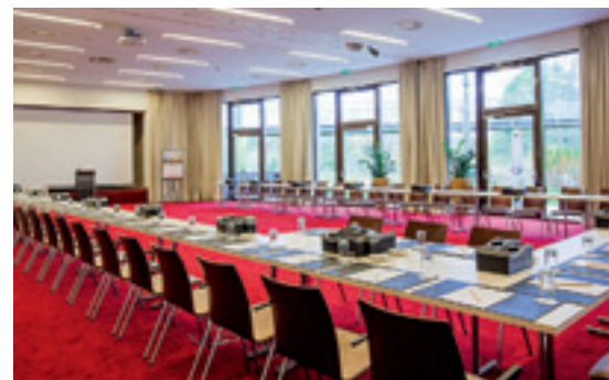
Zentraler Anlaufpunkt für Veranstaltungsplaner ist der Raum Alpe-Adria , der mit maximal 200 Personen bespielbar ist und direkten Zugang zum 3.000 Quadratmeter großen Hotelpark bietet

Für die Business-Ansprüche gibt es darüber hinaus noch insgesamt fünf Meetingräume. Drei davon befinden sich auf der sogenannten Parkebene, die wie es der Name schon vermuten lässt, einen direkten Ausgang zum Hotelpark