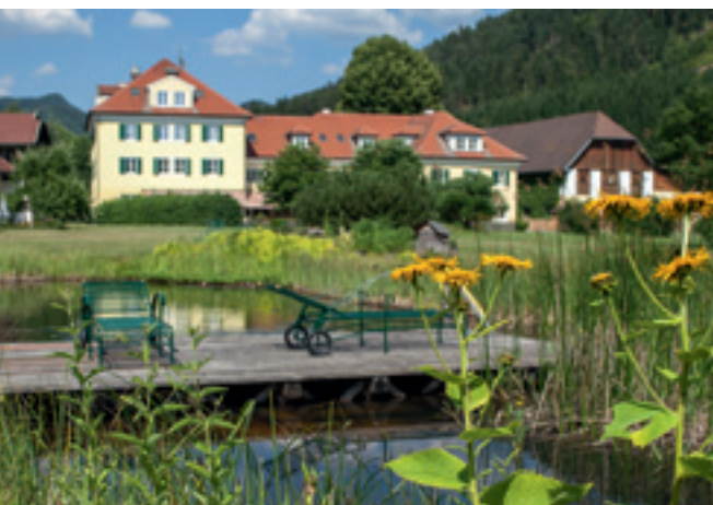
Bereits 400 Jahre steht das alte Gutshaus in der Nähe von Launsdorf.

... liegt das Glück dieser Erde. Jeder Reiter oder Pferdebegeisterte würde diesen Satz sicher sofort unterstreichen. Aber was haben Veranstaltungsplaner davon? Kurz gesagt: Eine gute Kombination zwischen effektiver Arbeitsumgebung und interessantem Team-Building, zumindest auf dem Dienstl Gut in Launsdorf. Wer jetzt allerdings „Back to the Nature“ oder „Schlafen auf dem Heuboden“ befürchtet, kann beruhigt sein. Auf dem mittlerweile 400 Jahre alten Gelände des Reiterhofes