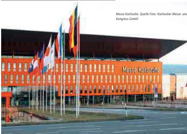
Messe Karlsruhe.