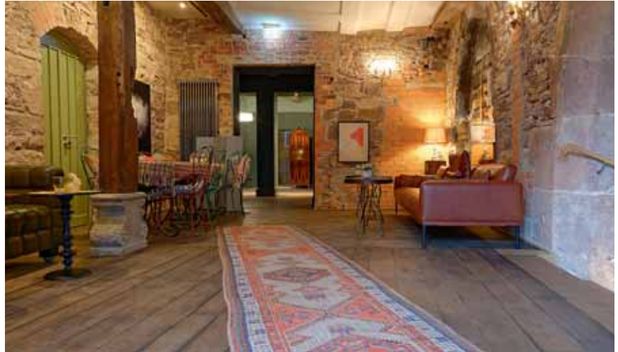
Eine einmalige Mischung aus gotischen Spitzbögen, historischem Mauerstein und modernem Mobiliar umgibt den Gast im Hotel Renthof. Frische Blumen auf dem Tisch und Stoffservietten perfektionieren den Einsatz natürlicher Materialien.

Die Möbel wurden individuell mit viel Liebe in Italien, Schweden, den Niederlanden und in Frankreich zusammengesucht. Im Zimmer steht eine alte, dunkelbraune Holzbank neben dem Sofa und erfüllt perfekt die Funktion eines Tisches. Neben dem Schreibtisch befindet sich auf dem Boden ein Blecheimer mit der Aufschrift „Water Bucket“ als Papierkorb. Die Toilette ist mit integriertem Bidet und die Matratzen sind zu 100 Prozent aus Naturmaterialien wie Kokosnusssfasern, Naturkautschuk, Baumwolle, Algen, Seide und Leinen.