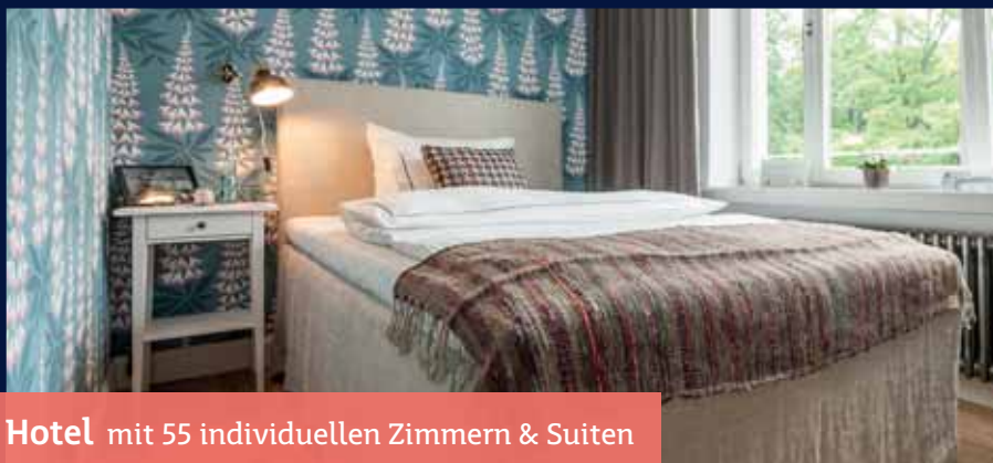
Hotel mit 55 individuellen Zimmern & Suiten