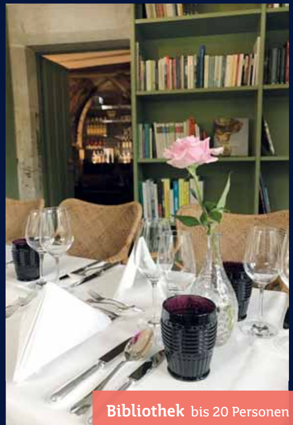
Bibliothek bis 20 Personen