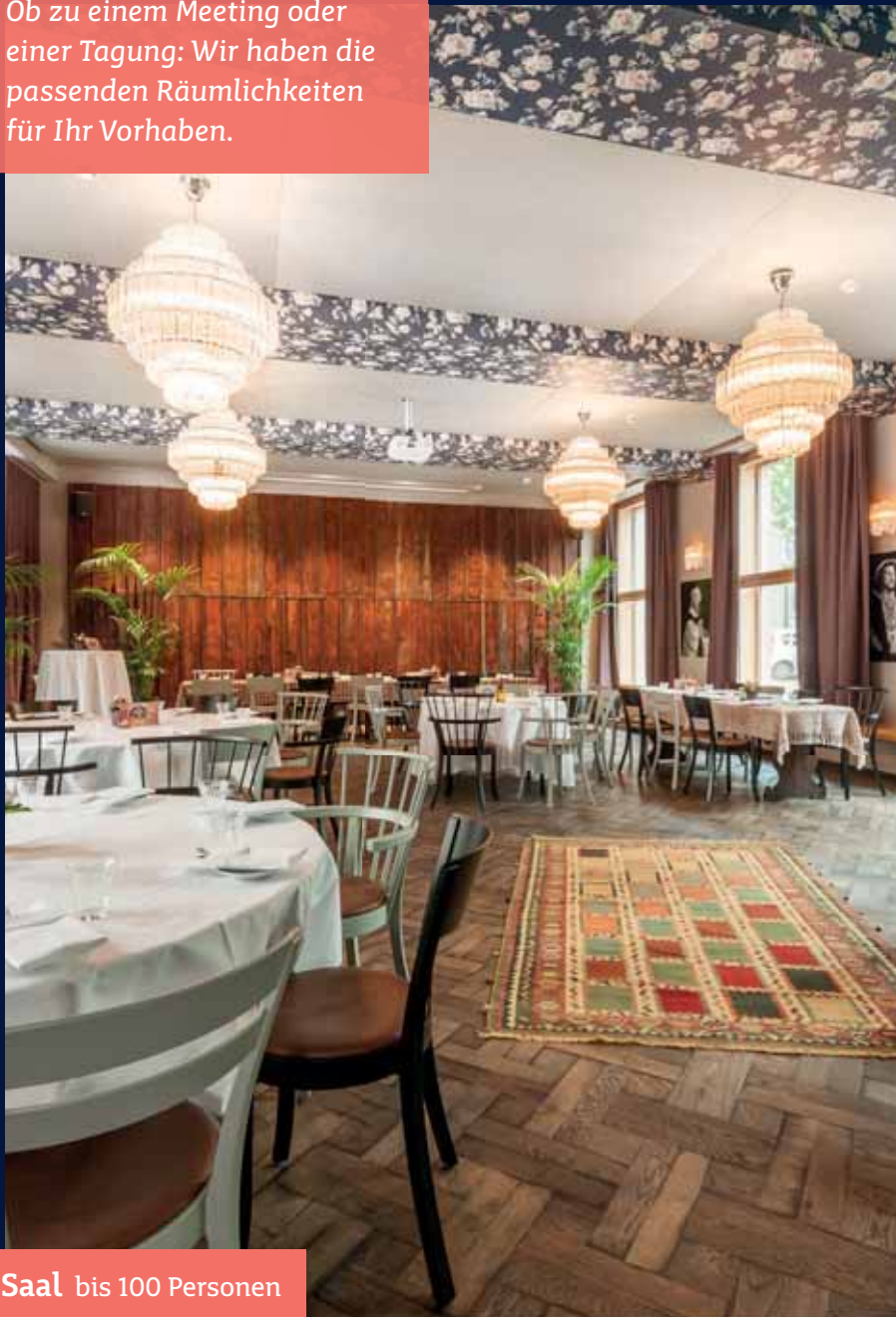
Saal bis 100 Personen

Ob zu einem Meeting oder einer Tagung: Wir haben die passenden Räumlichkeiten für Ihr Vorhaben.