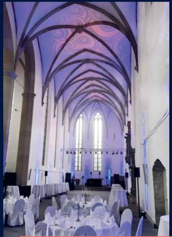
Alte Brüderkirche bis 350 Personen