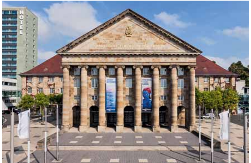
Das Kongress Palais Kassel wird von Oliver Höppner geleitet. Er möchte das Profil als Location schärfen und so für Planer noch attraktiver machen.

Wer eine Messe oder einen Kongress im Palais veranstaltet, kann sich über die Vielfalt der Räume freuen. Für die Plenarsit-