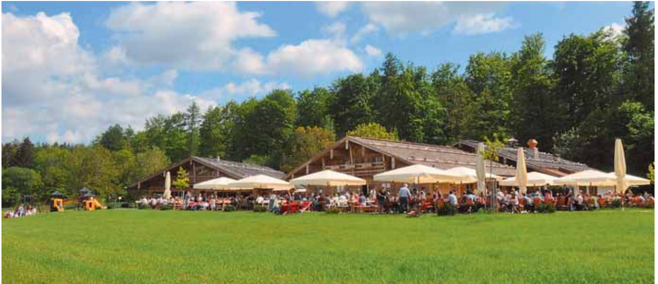
Wer hier die Zeit verbringt, wöhnt sich im Allgäu. Die Königs-Alm besticht durch ihr uriges Ambiente. Das Mobiliar ist zum Teil 200 Jahre alt.

Mit einem herrlichen Blick über Hessens kleinste Gemeinde Nieste bis hinein ins Gläsnertal lädt die Königs-Alm ein. Elf Kilometer östlich des Flusses Fulda in Kassel betreiben Hartmut Apel und seine Tochter Denise Seeger hier zwei rustikale Almhöfen mit Platz für rund 250 Gäste innen und weitere 200 Gäste außen. Das Alpen-Ambiente wird durch das zum Teil rund 200 Jahre alte Holzmobiliar sowie die bayerische Festmusik unterstrichen. Die Bedienung trägt Dirndl und die Karte bietet hessische und bayerische Schmankerl. Eventplaner können die komplette Almhütte exklusiv mieten oder Teile davon nutzen.