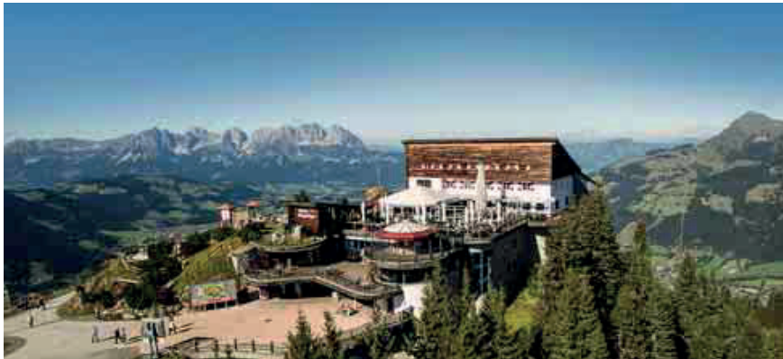
Auf knapp 1.700 Metern thront das Restaurant Hochkitzbüchel am Hahnenkamm – fantastische Ausblicke und hervorragende Konferenzmöglichkeiten inklusive.

Während sich die meisten alpinen Destinationen schon über einen sogenannten Hausberg definieren, verfügt Kitzbühel gleich über zwei: das Kitzbüheler Horn und den Hahnenkamm. Für Planer sind beide interessant, jeweils mit ganz unterschiedlichen Möglichkeiten.