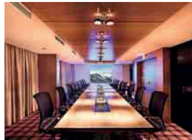
Tagen über der Rezeption: Der Boardroom des Hauses liegt direkt oberhalb der Rezeption und bietet Platz für bis zu 20 Personen.

Ebenfalls in der Nähe der Lobby, allerdings auf gleicher Ebene, befinden sich die beiden miteinander kombinierbaren Räume „Putter“ und „Driver“. Jeweils 60 qm groß, mit Tageslicht und einem separaten Eingang. Durch die Möglichkeit der Kombination können kleinere Gruppen auch vollkommen ungestört und autark vom restlichen Hotelbetrieb tagen und konferieren. Wird beispielsweise der eine Teil – mit einer Maximalbelegung von 40 Personen – bespielt, kann der andere Teil für Pausen und Coffee-Breaks genutzt werden.