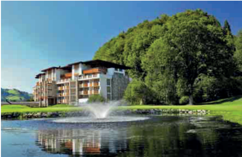
Idyllisch gelegen: Das Grand Tirolia liegt inmitten des 18-Loch-Golfplatzes Eichenheim.

Eingebettet in den Golfplatz Eichenheim, überblickt das Grand Tirolia das weite Grün ebenso wie die Bergwelt Kitzbühels. Seit 2009 empfängt das Fünf-Sterne-Hotel seine Gäste und hat sich seitdem nicht nur in der Hotellandschaft Kitzbühels etabliert, sondern auch als Partner für die MICE-Branche einen Namen gemacht.