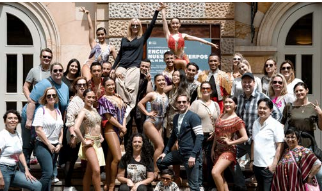
Vom Flashmob zum Salsa-Tanzkurs mitten in der Altstadt von Bogotá: eine ganz besondere Idee, den Tanz in das Programm einzubinden.

nen in Empfang genommen, wurde uns die Geschichte der Markthalle erzählt, welche Bedeutung die Halle noch heute hat und was die Besonderheiten sind. Grundsätzlich lässt sich sagen, dass sich im Mercado La Perseverancia die gesamte Viel-