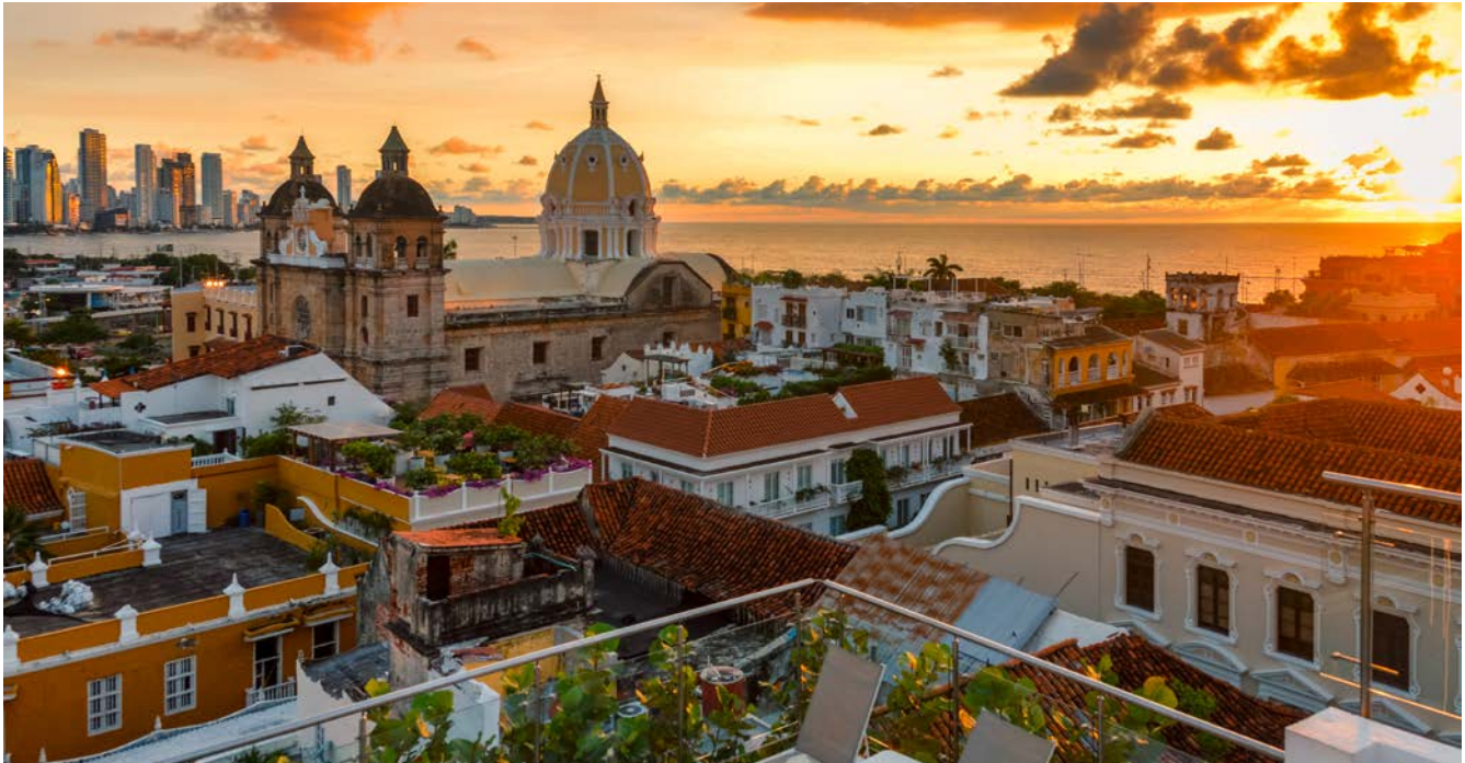
Cartagena ist ein absolutes Highlight in Kolumbien. Von der historischen Altstadt bis zur modernen Skyline bietet die Stadt alles.

Nach einem kurzen Flug – wieder mit Avianca – erreichten wir unser drittes Ziel in Kolumbien. Cartagena ist wohl eines der beliebtesten Tourismus-Ziele des Landes. Das allerdings ist auch nicht verwunderlich. Denn der Kontrast zwischen historischer Altstadt, langen Sandstränden und dem karibischen Flair ist beeindruckend.