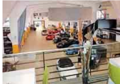
Die zentrale Haupthalle – geeignet für Produktpräsentationen, Seminare oder Empfänge.

2011 ERÖFFNET, HAT sich das Lenkwerk innerhalb kurzer Zeit, auch außerhalb Bielefelds, einen Namen gemacht. Ursprünglich 1940 für das Bekleidungsamt der Luftwaffe erbaut und später von der britischen Rheinarmee genutzt, entstand in der seit 1994 unter Denkmalschutz stehenden Anlage eine Eventlocation nicht nur für Old- und Youngtimer-Fans. Um die zentrale Haupthalle herum gruppieren sich Werkstätten, Dienstleister, ein italienisches Restaurant und eine der größten Niederlassungen der Kultmarke Harley-Davidson. Auf der ersten Etage befinden sich vier neugestaltete Seminarräume, eingerichtet mit moderner Technik, WLAN, Klimaanlage und Tageslicht. Die Räume, benannt nach den bekanntesten Rennstrecken der Welt, bieten Platz für bis zu 160 Personen. Die eigenen Fahrzeuge des Drivers Club können im Rahmen einer Firmenveranstaltung ebenso mit eingebunden werden wie die hauseigene Carrera-Bahn.