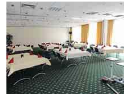
Flexibler Tagungsbereich.