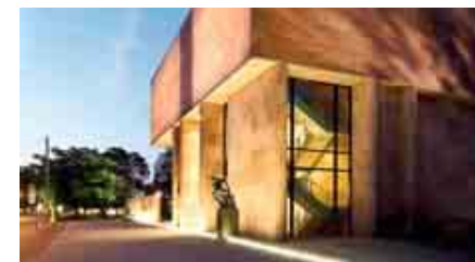
Ein Bielefelder Wahrzeichen der Moderne.