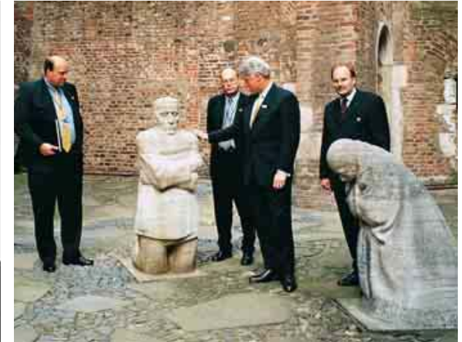
Es war ein großer Tag für Köln Kongress und Chef Conin, als der damalige US-Präsident Bill Clinton Köln besuchte

Conin: Überhaupt nicht! Ich bin sehr stolz darauf, wie viele Reservierungen wir schon für 2014 und 2015 haben. Viele Menschen, Firmen, Verbände und Vereine, nicht nur aus Köln, werden hier feiern.