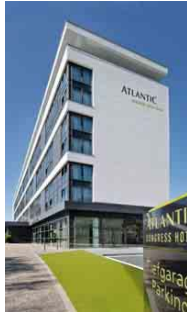
Zentral gelegen neben Messe und Congress Center

Das im Januar 2010 eröffnete Vier-Sterne-Superior-Haus verfügt über 248 Zimmer und Suiten. Darüber hinaus ist für Veranstaltungsplaner insbesondere der Tagungsbereich von Bedeutung. Als Mittelpunkt des MICE-Bereiches fungiert das großräumig angelegte Foyer, von dem auch alle insgesamt neun Tagungsräume aus erreichbar sind. Durch eine entsprechende Kombination oder Alleinnutzung entstehen hier Kapazitäten von zwölf bis 600 Personen. Das gewisse Etwas für Veranstaltungen findet sich auf der Dachterrasse des Hotels, die exklusiv für Veranstaltungen beispielbar ist. Mit einem Rundumblick über Essen bietet die Terrasse insbesondere in den Sommermonaten den perfekten Rahmen für stimmungsvolle Events. Aber auch für kältere Monate findet sich im Atlantic Congress Hotel eine ganz besondere Location. Die wetterfeste Vinothek befindet sich im Keller-