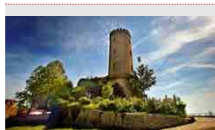
Bielefelds Wahrzeichen: die Sparenburg.

Die ostwestfälische Metropole wurde um das Jahr 1214 vom Ravensberger Grafen Hermann als Kaufmannsstadt gegründet und hat sich von den Ursprüngen der Leinenweberei zu einer modernen Großstadt entwickelt. In diesem Jahr wird das 800-jährige Stadtjubiläum mit vielen Veranstaltungen in der ganzen Stadt gefeiert. Mit fast 330.000 Einwohnern auf einer Fläche von 258 Quadratkilometern gehört der Universitäts- und Fachhochschulstandort Bielefeld zu den 20 größten Städten Deutschlands. Bielefeld bietet dem Besucher ein abwechslungsreiches Bild: Große Grünanlagen, herrliche Parks und viele Wälder bieten Entspannung für Erholungssuchende. Die kleine, aber feine Altstadt lockt mit dem Alten Markt, an dem sich viele Restaurants und Cafés angesiedelt haben. Hinter dem Hauptbahnhof reizt der Boulevard mit seinen Restaurants, Kino-, Sport- und Wellnessmöglichkeiten. www.bielefeld.de