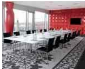
Wer bei der Besprechung Richtung Fensterfront blickt, kann vom Kameha Grand Bonn aus auf den Rhein schauen.

DIESEN SPRUCH findet man auf der Homepage des Kameha Grand Bonn. Und wenn man sich das im rechts-rheinischen Bonn-Ramersdorf liegende Fünf-Sterne-Haus anschaut, versteht man ihn auch. Das Hotel präsentiert sich als exklusive Adresse in der ehemaligen Hauptstadt. Stylistisch kommt das 2009 eröffnete Hotel der schweizerischen Hotelgruppe daher und bietet