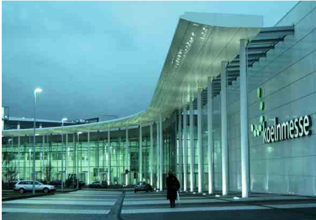
Auch für die sehr großen MICE-Veranstaltungen immer die richtige Größe: Congress-Centrum Koelnmesse.