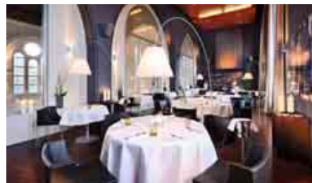
Restaurant Glück und Seligkeit.

Die Kunsthalle Bielefeld, erbaut 1968 vom New Yorker Architekten Philip Johnson (1906-2005), ist bundesweit bekannt für hochkarätige Ausstellungen zeitgenössischer Kunst. Bis Juni 2014 läuft eine Ausstellung über regionale Bielefelder Künstler der Kunstrichtung Expressionismus. Das Foyer der repräsentativen Ausstellungshalle (bis 120 Personen) kann ebenso für Veranstaltungen genutzt werden wie der Vortragsaal mit 244 Plätzen. www.kunsthalle-bielefeld.de