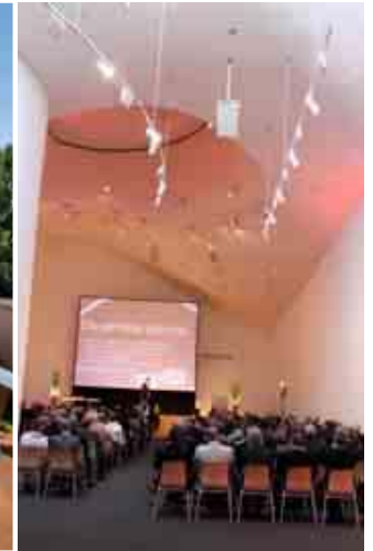
Stürzende und aufragende, wirbelnde Formen: typisch für die Marta, entworfen von Star-Architekt Frank O. Gehry

ION, FROMMHOLZ, HETTICH ODER POGGEN-POHL heißen die Kunden beispielsweise. Sie nutzen zur Präsentation ihrer Produkte und Dienstleistungen eines der innovativsten Museumsbauten weltweit: Marta Herford. Diese Raumskulptur, mit ihrer Choreographie der Volumen, dem stürzenden und aufragenden, wirbelnden Formen beherbergt ein ganzes „Kreativ-System“ aus Ausstellungsräumen, Veranstaltungsforum, Gastronomie, Shop, Seminarräumen und Büros: Marta Herford beschreibt sich als ein lebendiger Ort der Begegnung zum interkulturellen Dialog. Das Museum steht in Herford, kurz vor den Toren Bielefelds. Das im Jahr 2005 eröffnete Museum für zeitgenössische Kunst schafft unter dem spektakulären Edelstahldach von Stararchi-