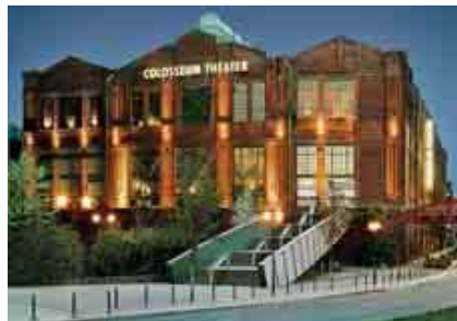
Industrie in Reinkultur: das Colosseum Theater in den ehemaligen Krupp-Fabrikhallen bietet Raum für exklusive Events.

Die Zeche Zollverein – oder auch die schönste Zeche der Welt – verfügt über 14.000 Quadratmeter Veranstaltungsfläche. Vom kleinen Studio bis hin zu Messe- oder Ausstellungshallen findet sich für jede Veranstaltung der passen-