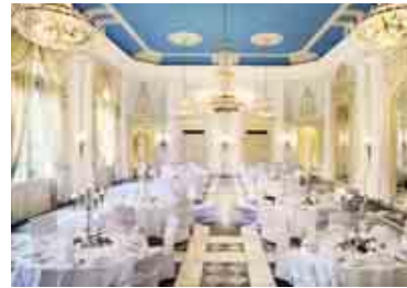
Herzstück der Redoute: Der Beethovensaal.

gen Veranstalter in der La Redoute ihre Gäste. Diese Top-Location bietet verschiedene Räumlichkeiten. Das Schmuckstück im Raumensemble ist aber zweifelsohne der Beethovensaal. Veranstaltungen bis zu 296 Personen sind in diesem Saal ohne weiteres möglich. Bei einer Kombination mit dem Gartensaal sind sogar Empfänge für bis zu 700 Personen realisierbar. Für kleinere Veranstaltungen entscheidet sich der MICE-Planer für einen der Salons, die auf einer Größe zwischen 25 und 77 Quadratmetern, genug Raum für Tagungen, Konferenzen, Feierlichkeiten oder Seminare bieten.