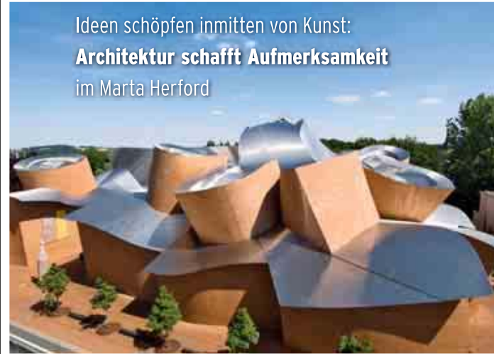
Das Marta ist einer der innovativsten Museumsbauten weltweit. Ein eigenes Event-Team hat Ideen für Firmenveranstaltungen darin.