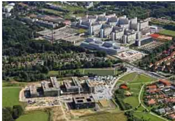
Campus Bielefeld.

BIS 2025 INVESTIERT das Land Nordrhein-Westfalen über eine Milliarde in den Wissenschaftsstandort Bielefeld. Die Universität Bielefeld umfasst heute 13 Fakultäten mit einem Fächerspektrum von Geistes- bis Naturwissenschaften, von Sozial- bis Technikwissenschaften. Mit etwa 35.000 Studierenden in über