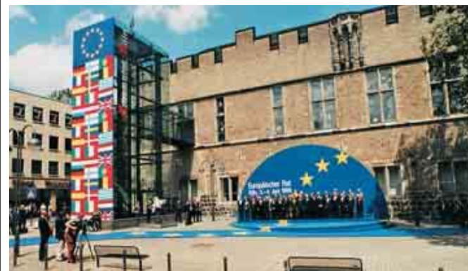
Gesammelte Politik-Macht: Im Gürzenich tagte vor 15 Jahren der Europäische Rat