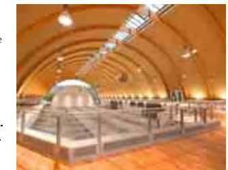
Ausstellungshalle der Stadthalle Bielefeld

sollte – im Umkreis von nur 1,5 Kilometern stehen über 1.500 Hotelbetten zur Verfügung. Das integrierte Parkhaus stellt