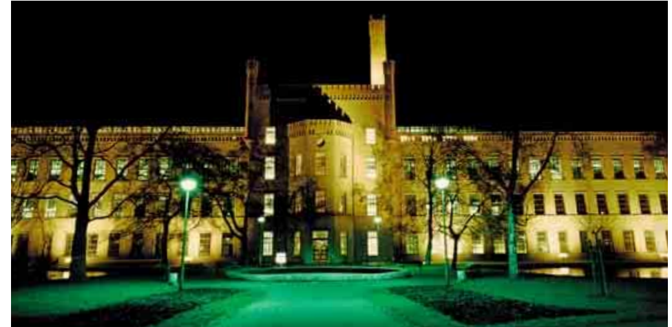
Ravensberger Spinnerei – hier wurde Industriegeschichte geschrieben.