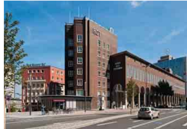
Veranstaltungen mit bis zu 700 Teilnehmern sind im Haus der Technik möglich.

den Rahmen. Insgesamt 40 unterschiedliche Räumlichkeiten finden sich auf dem Gelände. Unter dem Dach Zollverein-Convention steht darüber hinaus ein Netzwerk von acht Location-Anbietern auf dem Gelände mit Rat und Tat zur Seite. www.convention-zollverein.de