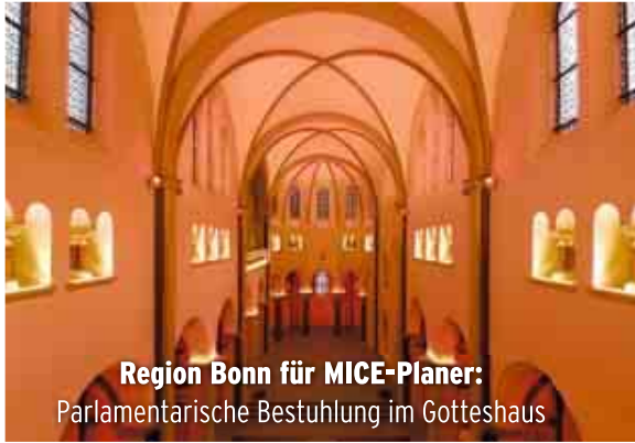
Region Bonn für MICE-Planer: Parlamentarische Bestuhlung im Gotteshaus

gen Veranstalter in der La Redoute ihre Gäste. Diese Top-Location bietet verschiedene Räumlichkeiten. Das Schmuckstück im Raumensemble ist aber zweifelsohne der Beethovensaal. Veranstaltungen bis zu 296 Personen sind in diesem Saal ohne weiteres möglich. Bei einer Kombination mit dem Gartensaal sind sogar Empfänge für bis zu 700 Personen realisierbar. Für kleinere Veranstaltungen entscheidet sich der MICE-Planer für einen der Salons, die auf einer Größe zwischen 25 und 77 Quadratmetern, genug Raum für Tagungen, Konferenzen, Feierlichkeiten oder Seminare bieten.