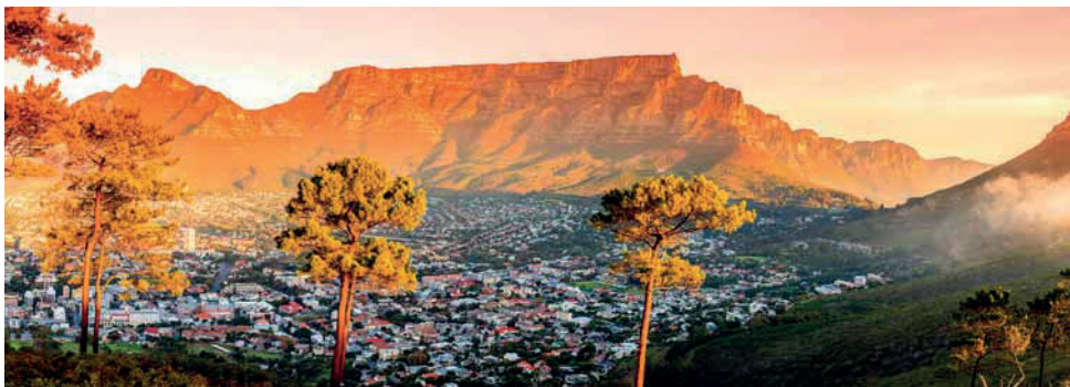
Der Tafelberg ist ein mehr als imposantes Wiedererkennungsmerkmal für die älteste Stadt Südafrikas. Jedoch hat Kapstadt darüber hinaus einiges zu bieten, insbesondere für die MICE-Branche.